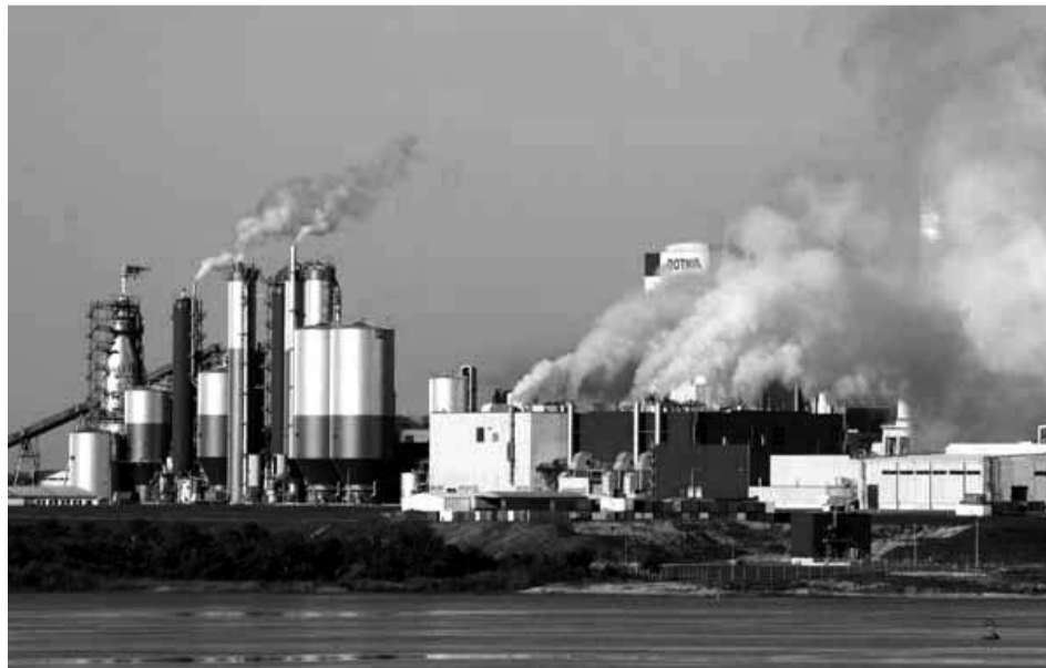
BOTNIA / UPM - URUGUAY

7. La CIPOML hace un llamado a todos los partidos y organizaciones a observar el Día Internacional del Medio Ambiente el 4 de diciembre como un día de protesta combativa basado en el enfoque antedicho.