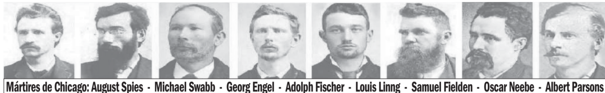
Mártires de Chicago: August Spies - Michael Swabb - Georg Engel - Adolph Fischer - Louis Linng - Samuel Fielden - Oscar Neebe - Albert Parsons

El 1º de Mayo es una fecha histórica de vital importancia para la lucha de los trabajadores del mundo. En este día de 1886, 200 mil trabajadores en Chicago empezaban una huelga con la reivindicación de que se cumpliera con la ley de 8 horas de trabajo. Continuaron las movilizaciones los días 2 y 3 de mayo de ese año.