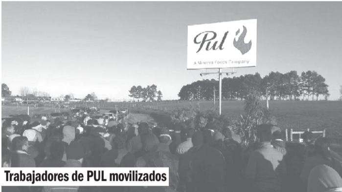
Trabajadores de PUL movilizados

Es crítica la situación de la industria Frigorífica, visto que se enviaron en una sola semana más de 1000 obreros al seguro de paro. Tenemos los 500 trabajadores enviados al seguro de paro del frigorífico PUL en Cerro Largo, los 600 trabajadores de "Matadero Rosario" de dicha ciudad y "Establecimiento Colonia" en Tarariras, en todos los casos se argumenta la imposibilidad de poder colocar la faena, por esto supuestamente reducen la producción "para ahorrar costos" y a esto se le agrega el conflicto del frigorífico municipal en Salto donde hay despidos antisindicales entre ellos el del delegado sindical.