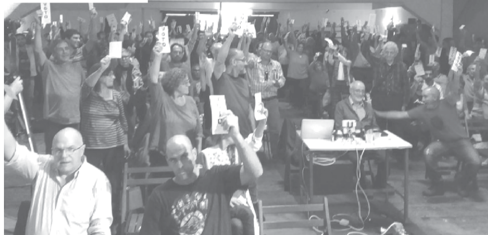
Aprobación por unanimidad de la candidatura del cro. Gonzalo Abella a la Presidencia de la República para las Elecciones 2019