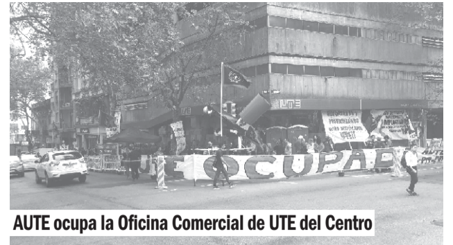
AUTE ocupa la Oficina Comercial de UTE del Centro

El miércoles 26 de abril se llevó a cabo una asamblea por el tema del sector de necrópolis para determinar medidas y las negociaciones tripartitas continúan el jueves. Mientras tanto, se mantiene el conflicto de necrópolis, aunque sin cortar el servicio, pero mantienen medidas distorsivas (no recoger cuerpos sin identificar de las morgues), los trabajadores están realizando las medidas de esta manera a partir del decreto de esencialidad emitido por el gobierno departamental de Daniel Martínez que recayó sobre ellos cuando realizaron la huelga. La asamblea decidió rechazar dichos y acciones de Martínez sobre este tema, marcar la necesidad de presupuesto, denunciar las tercerizaciones y la represión sindical en el sector.