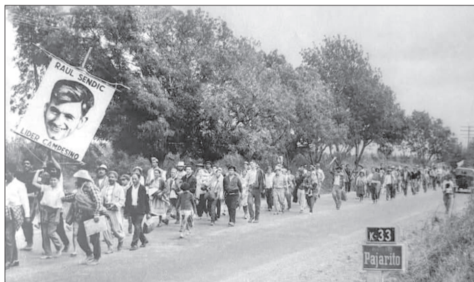
Marcha cañera que parte de Bella Unión, Artigas el 20 de febrero de 1964.

creció la presencia de capitales extranjeros pasando de poseer el 2% de las tierras orientales en los setenta del siglo pasado a rondar el 50% en la actualidad.